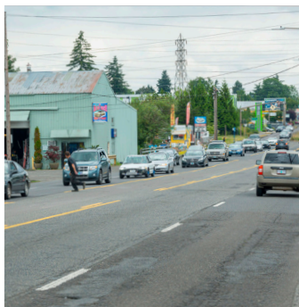
Nhựa đường hiện tại cần sửa chữa.

Via hè mới cải thiện tình trạng tồi tệ của con đường để mang lại mặt đường lái xe nhẵn, hoàn thiện và cải thiện sự an toàn cho người lái xe trong hành lang vận chuyển đông đúc này.