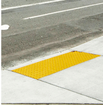
Ví dụ về lối lên xuống lề đường được nâng cấp tuân thủ Đạo luật.

Via hè mới, khoảng giữa SE Clatsop Street và SE Cornwell Street, cung cấp khả năng tiếp cận an toàn và cải thiện kết nối cho tất cả những người sử dụng vỉa hè.