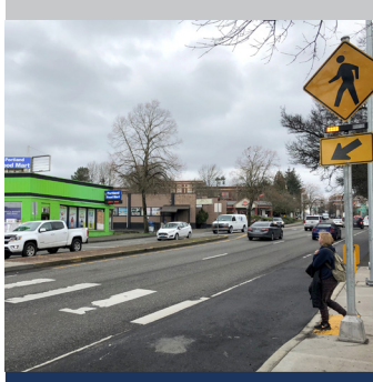
Ví dụ về RRFB gần cạnh bên.

Via hè mới cải thiện tình trạng tồi tệ của con đường để mang lại mặt đường lái xe nhẵn, hoàn thiện và cải thiện sự an toàn cho người lái xe trong hành lang vận chuyển đông đúc này.